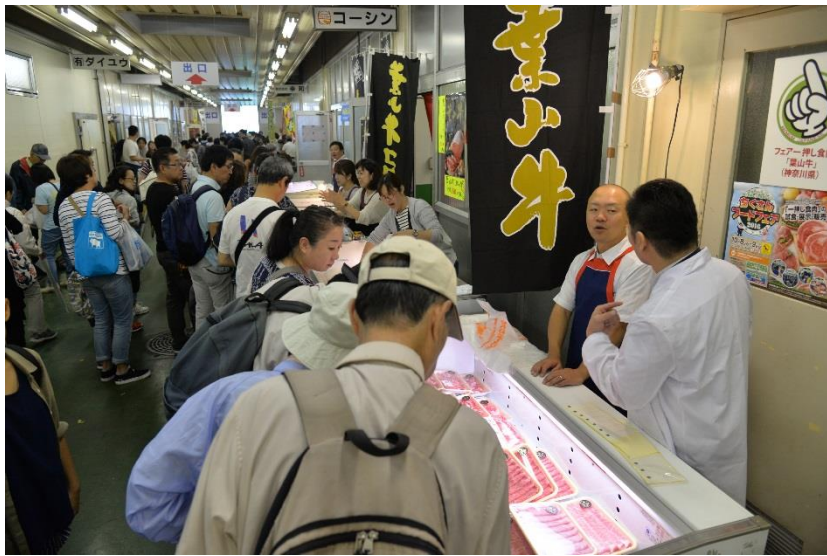
全国味めぐりコーナー