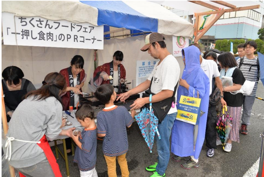
一押し食肉PRコーナー 「さつまビーフ」PR