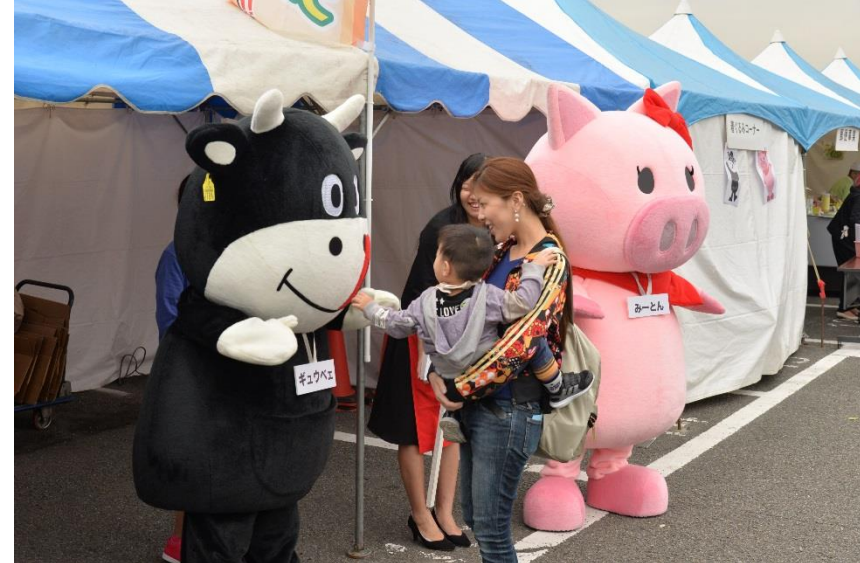
フェアキャラクター「ギュウベエ」と「みーとん」