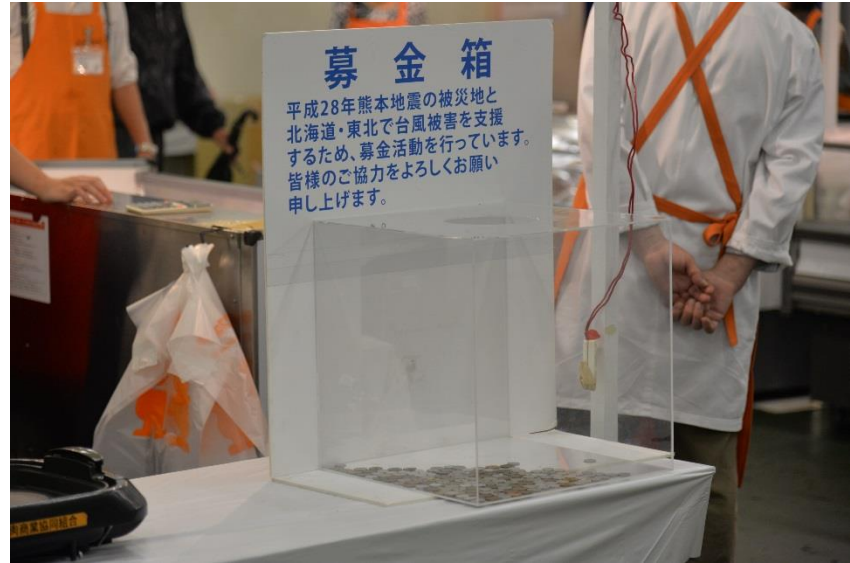
地域物産コーナー