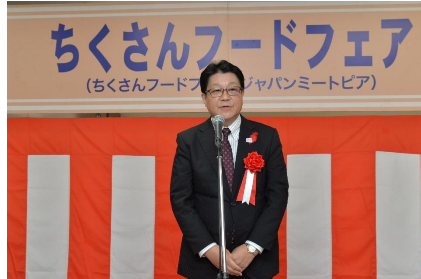
来賓祝辞（川崎市 伊藤副市長）